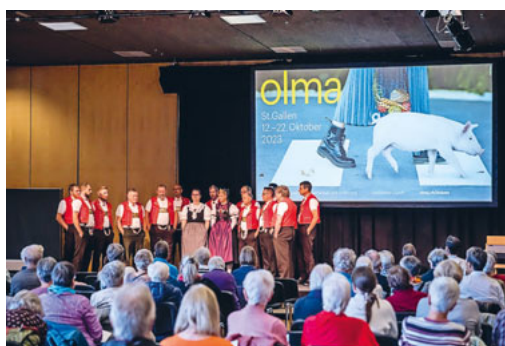
Der OLMA-Gottesdienst sorgte auch an der OLMA 2023 für echte Begegnungen.

Auch bewährte Klassiker fehlen nicht: Das tierische Arenaprogramm mit dem beliebten Säulirennen, das 24. OLMA-Schwinget und der OLMA-Familienparcours bieten Unterhaltung für die ganze Familie. Ein weiteres Highlight in