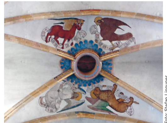
Evangelisten-Symbole im Ulmer Münster

Glauben ist entscheidend. Die erste Verkündigung von Jesus lautete: «Kehrt um und glaubt an das Evangelium!» [Markus 1,15], also an die frohe Botschaft vom Vater im Himmel, von Jesus Christus, seinem Leben, seinen Worten, seinem Sterben und Auferstehen und vom Wirken des Heiligen Geistes durch die Zeiten. Doch Glauben ist nur das Eine; das Andere ist Bekennen. «Mit dem Herzen glaubt man zur Gerechtigkeit, mit dem Mund bekennt man zur Seligkeit» [Römer 10,10]. – Darum wollen wir unseren Glauben stärken und vertiefen und gleichzeitig lernen, diesen Glauben zu bekennen. Die Gespräche über das Apostolische Glaubensbekenntnis können dabei helfen.