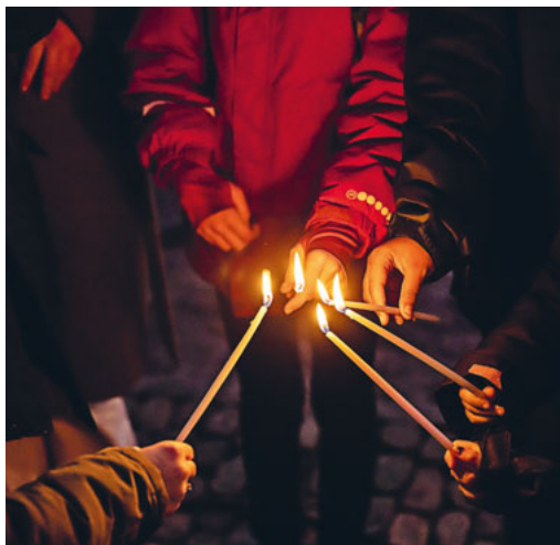
Licht im Dunkeln

Immer, wenn du denkst, es geht nicht mehr, kommt von irgendwo ein Lichtlein her, dass du es noch einmal zwingst und von Sonnenschein und Freude singst, leichter trägst des Alltags Last, bis du wieder Kraft und Mut und Glauben hast.