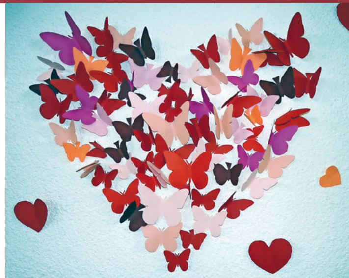
Ausschnitt Dekoration Konfirmation 12.5.2024.