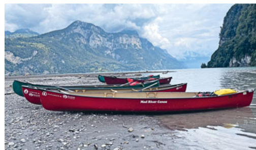
Impression Kanu Weekend